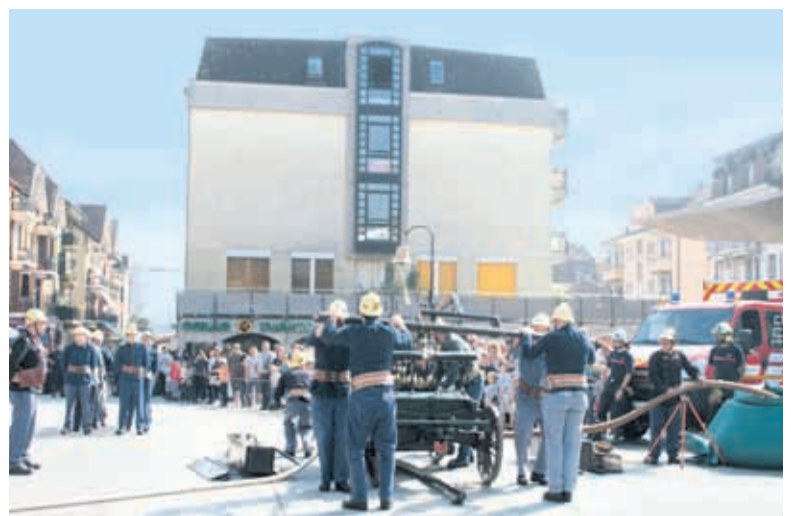
Les pompiers ont réalisé un exercice avec la vieille pompe à bras datant de 1871

Les personnes intéressées ont aussi pu obtenir diverses informations auprès des stands tenus par les partenaires des pompiers de Renens, soit la Police de l'Ouest lausannois, la Protection civile de l'Ouest lausannois, L'ECA et les Pompiers de Prilly et de Lausanne. ●