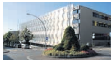
Le bâtiment de l'ECAL

Passé le giratoire de l'avenue du 24-Janvier, vous passez devant un salon de coiffure. A peine plus loin, un bar à café avec sa sympathique véranda et sa terrasse vous attend, avec cuisine à midi. Le matin vous pourrez y déguster un excellent croissant au jambon (encore chaud sorti du four) avec votre café.