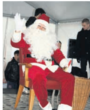
Le Père Noël sera de retour cette année sur la Place du Marché!

c/o Mobicel, ch. du Chêne 18 - 1020 Renens. ●