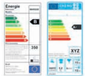
A gauche l'ancienne étiquette et à droite la nouvelle version

www.energyday.ch et www.suisse-energie.ch ●