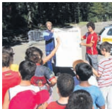
Les représentants du projet «Scool» avec quelques élèves

L'enthousiasme des coureurs a été récompensé par des maillots offerts à tous et des prix aux vainqueurs. Peut-être que ce jour-là certains élèves se sont découverts un intérêt pour ce sport peu onéreux, ludique et proche de la nature! Voir également www.scool.ch ●