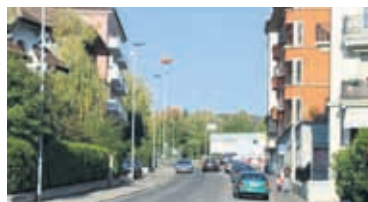
La rue de Verdeaux