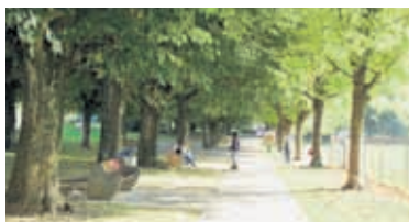
L'allée de platanes bordant le terrain de Verdeaux

En face du Temple de Renens, vous entrez dans le parc public pour vous rendre à la volière où vous pourrez admirer plusieurs espèces d'oiseaux. Ensuite, une magnifique allée de platanes bordant le terrain de foot de Verdeaux vous permet d'atteindre le Bugnon. Là se trouve un kiosque pour faire quelques emplettes.