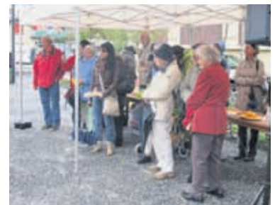
Malgré une forte pluie, plusieurs personnes sont venues assister à cette cérémonie au square de la Savonnerie

Cette plaque avait été posée par la Ville en octobre 2000 pour commémorer la journée du refus de la misère et en reconnaissance à l'association des Familles du Quart-Monde de l'Ouest lausannois pour les activités qu'elle mène dans sa lutte contre la pauvreté et la misère. Elle avait dû être retirée durant les travaux de rénovation de la Place du Marché. ●