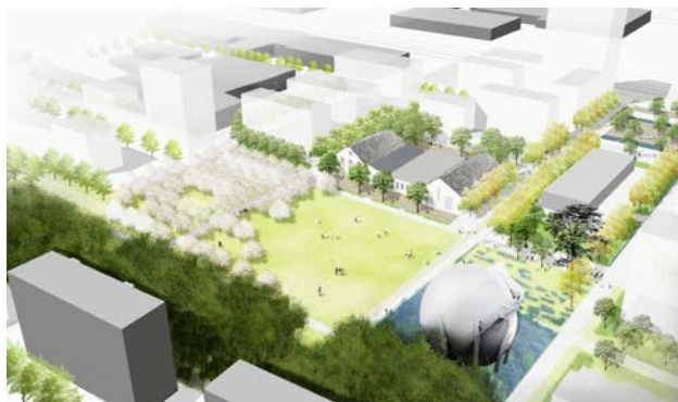
Vue sur le parc avec l'ancien gazomètre, FHY – In Situ/SDOL, 2012

Municipale de l'urbanisme et des travaux de la Ville de Renens et Présidente du Groupe décisionnel Malley du SDOL