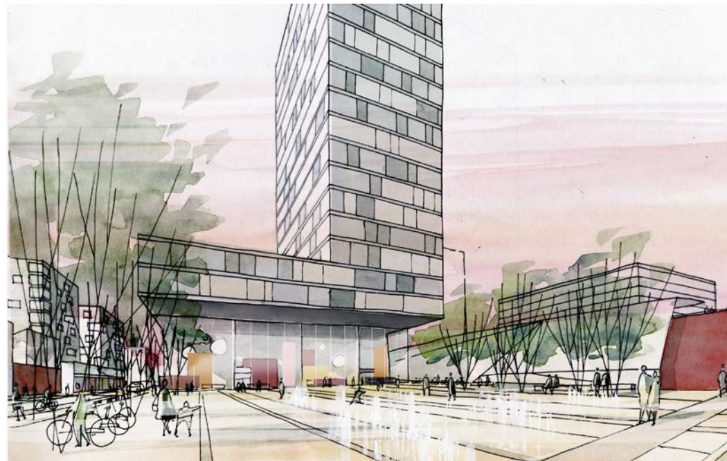
Vue sur la place de Malley, Louhat-FHY/SDOL, 2015

Le plan de quartier Malley-Gare met en place une stratégie globale pour réduire son impact sur l'environnement. La densité élevée du quartier y contribue. Il est également prévu de réduire fortement la génération de trafic grâce à une dépendance globale à la voiture moindre et par conséquent une forte diminution des effets sur le réseau routier existant. Enfin, une gestion écologique des ressources exemplaire (un concept énergétique inspiré de la «société à 2000 W» encourageant l'autonomie des bâtiments, des mesures visant la récupération des eaux pluviales, des toitures végétalisées pour une meilleure biodiversité, l'optimisation des densités bâties) est envisagée.