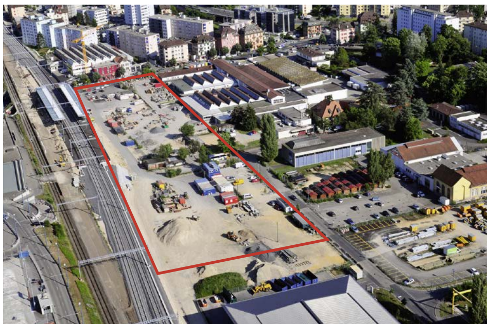
Vue aérienne du site du PQ Malley-Gare, Joël Christin/SDOL, 2011

Ce territoire n'est pas une étendue vierge, des traces industrielles (gazomètre, hangars, rails, plantes pionnières...) comme le théâtre voisin, forgent l'identité des lieux.